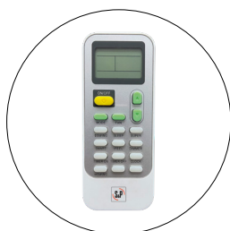
Control remoto inalámbrico con pantalla LCD